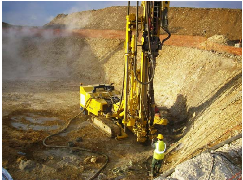
▲ Réalisation d'une colonne de CHS